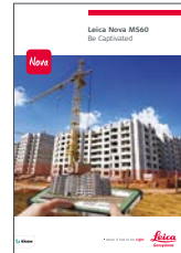
Leica Nova MS50